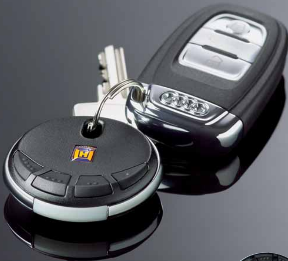
Telecomando HSP 4 para até quatro funções

O telecomando HSP 4 tem um novo, elegante e nobre design. Um anel cromado adicional e teclas pretas são responsáveis pela imagem moderna. O telecomando HSP 4 dispõe de quatro funções, incluindo bloqueio de emissão e um porta-chaves.