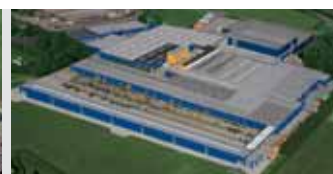
Hörmann KG Brockhagen