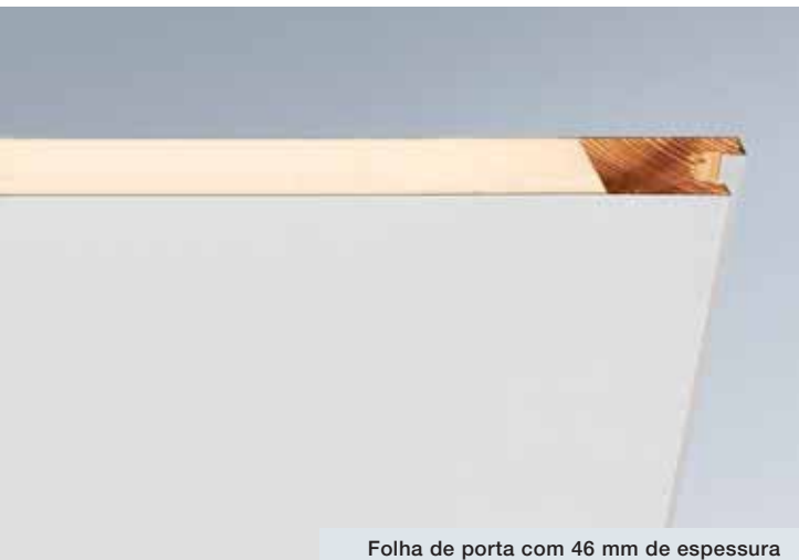
Folha de porta com 46 mm de espessura