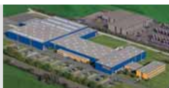
Hörmann KG Antriebstechnik