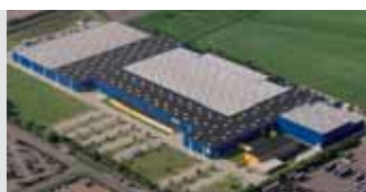
Hörmann KG Brandis