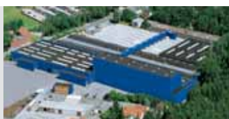
Hörmann KG Amshausen